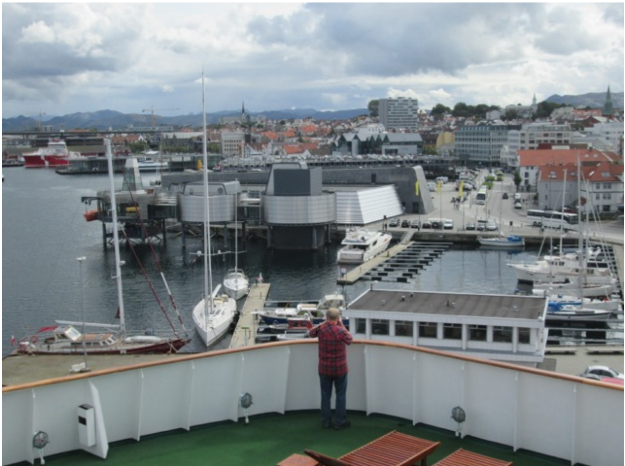
Ölmuseum von Stavanger