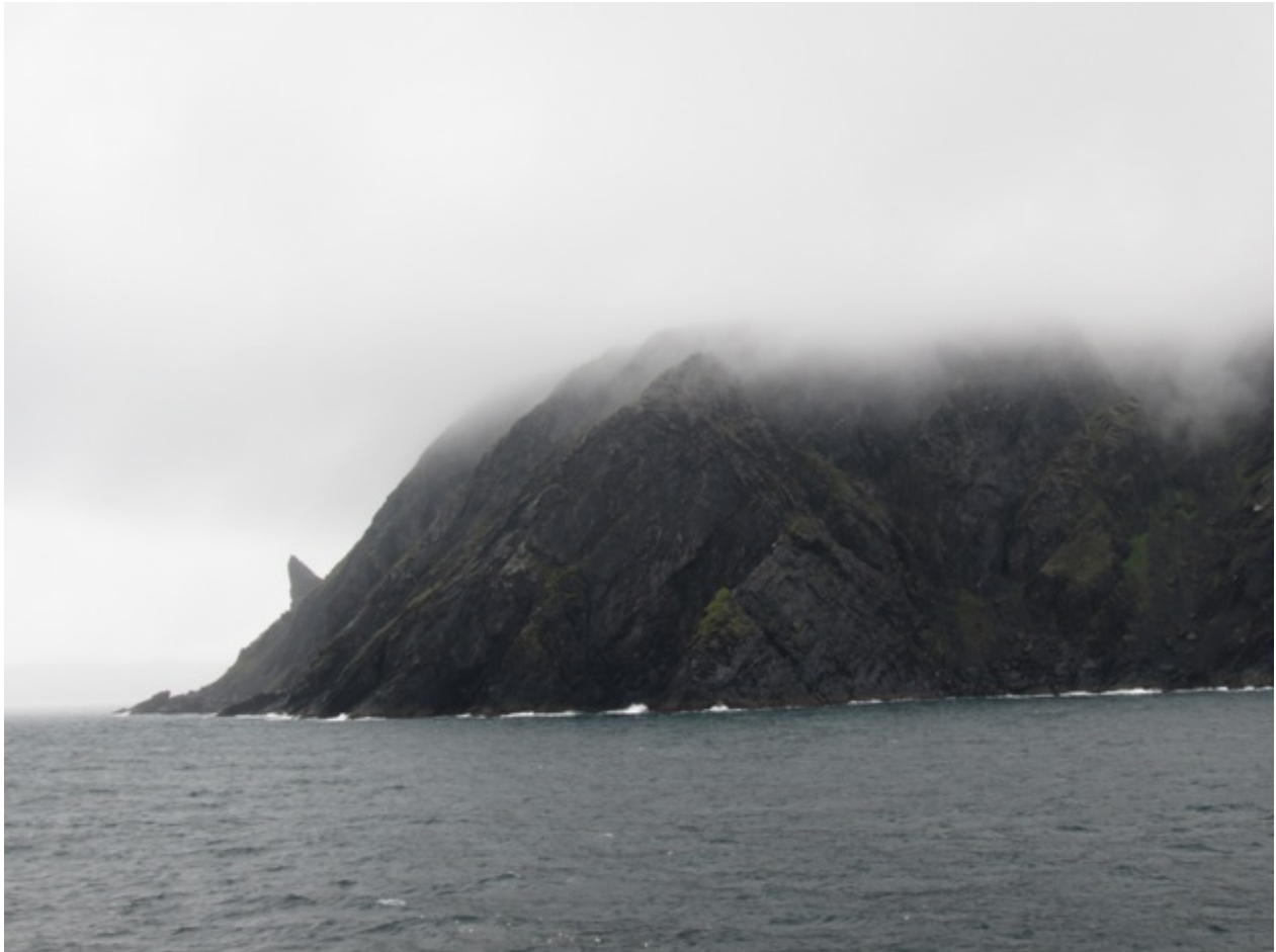
Nordkapp mit dem markanten Horn und schlechtem Wetter

12 = Orkan: Windgeschwindigkeit über 32,7 m/Sek.