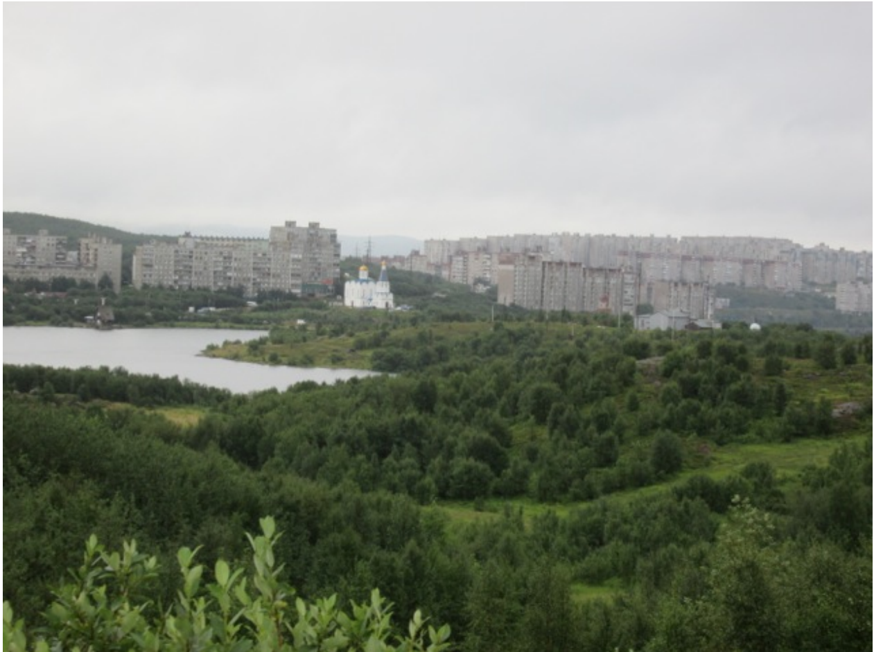
Murmansk mit den Plattenbauten und der neuen Kirche von 2006