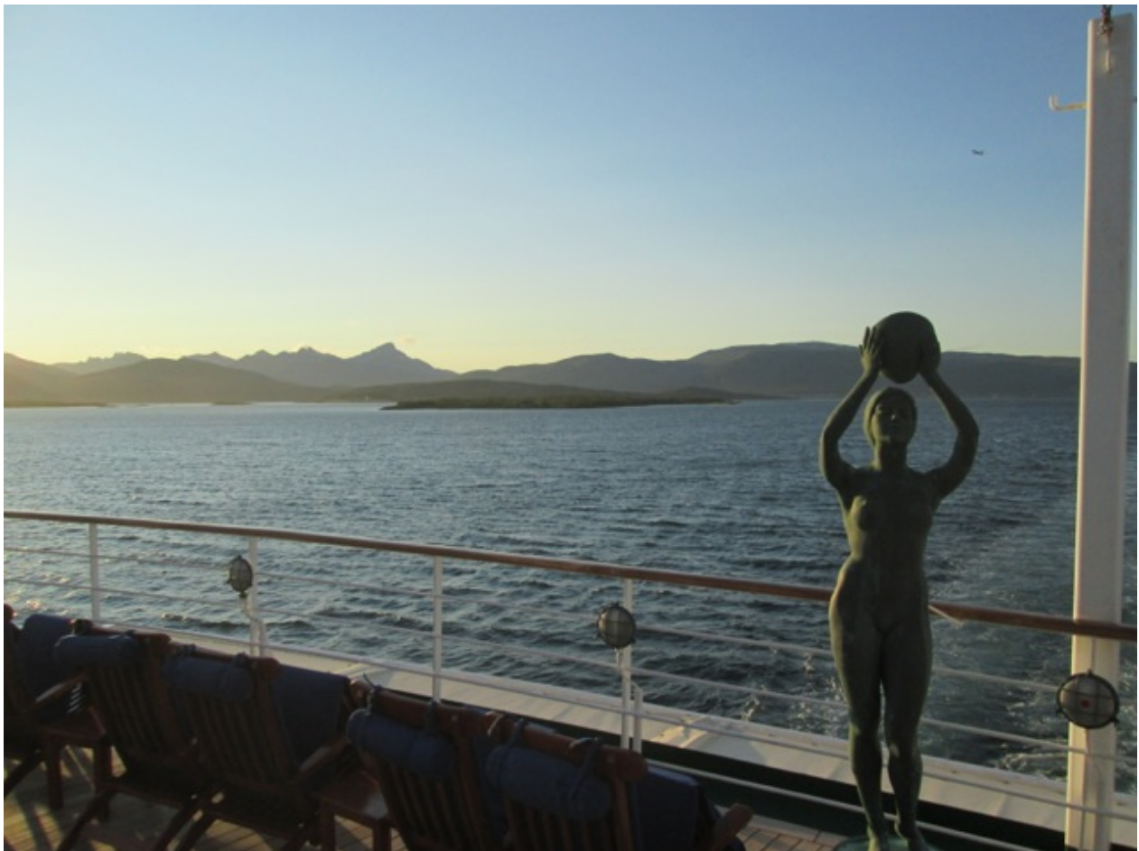
Inline-Passage nach Süden

Geruhvoller Nachmittag, eingepackt in Wolldecken durch die Inline-Passage von Hammerfest Richtung Süden.