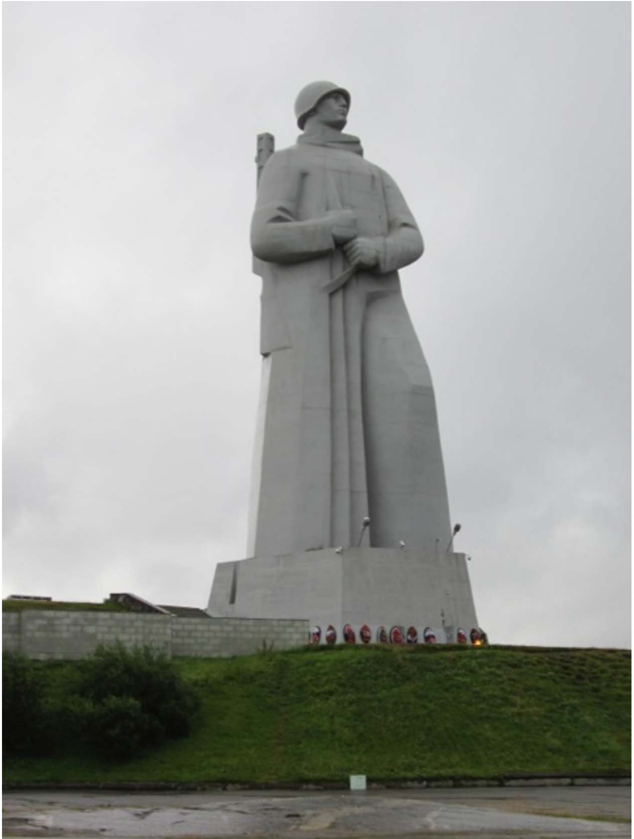
30m hohes Soldatendenkmal