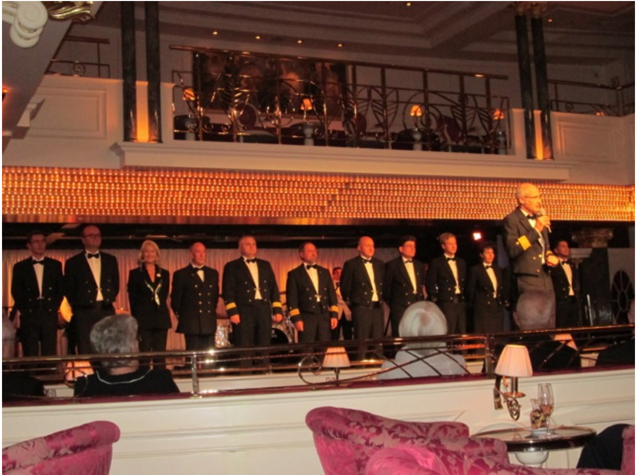
Abschiedscocktail im Kaisersaal mit dem Kapitän und den Offizieren

18 Uhr: Abschieds-Gala-Dinner für die Gäste der frühen Tischzeit.